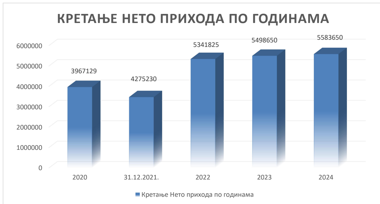
График кретања прихода по годинама

Приходи од приређивања игара на срећу имају сталну тенденцију раста у наредном трогодишњем плану чиме би Предузеће успјело обезбједити позитиван финансијски резултат од игара које чине основну дјелатност. Поред прихода од основних дјелатности у наредном периоду планирамо и остале приходе који ће бити врло значајни за обезбјеђење финансијске ликвидности тако и даљи развој Предузећа.