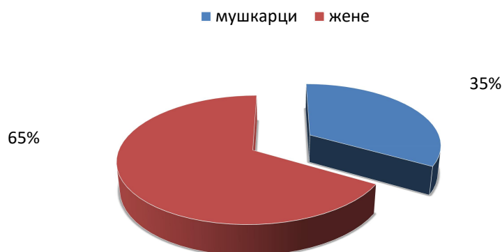
Полна структура радника